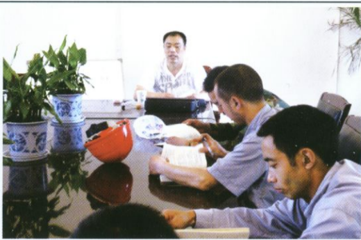
图为绵竹龙腾技术培训会场(绵竹市龙腾燃气安装有限责任公司通讯员报道)