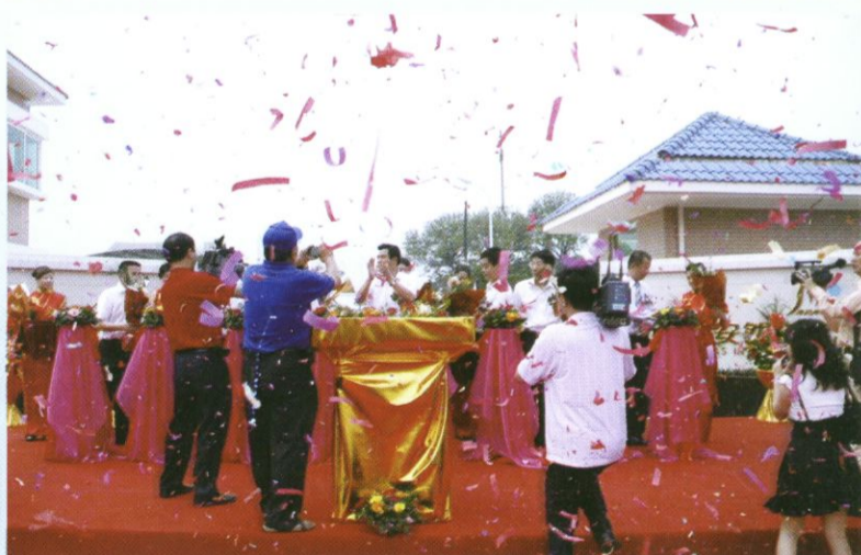
图为漳州市区领导为天然气通气点火剪彩