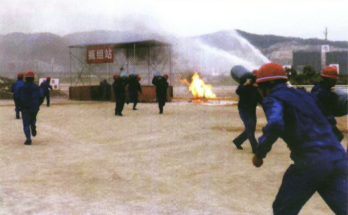
2009年8月3日,福建宁德安然组成燃气抢险分队参加“闽东-2009”民兵预备役部队能力建设演练,承担模拟燃气泄漏应急抢险任务,燃气抢险分队从参演队伍中脱颖而出,最终摘冠。图为演练现场。(宁德安然燃气有限公司通讯员报道)