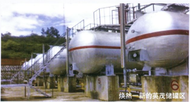
焕然一新的英茂储罐区