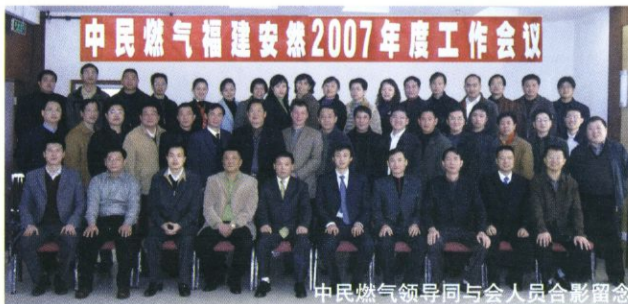
中民燃气领导同与会人员合影留念