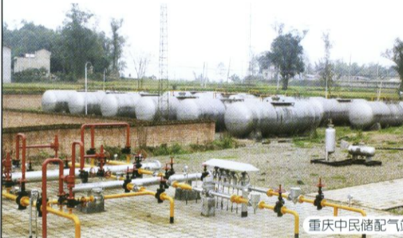
重庆中民储配气站

占地6700m 2 ，12个60m 3 储罐，可储存1万m 3 天然气，年供气能力11000万m 3 。