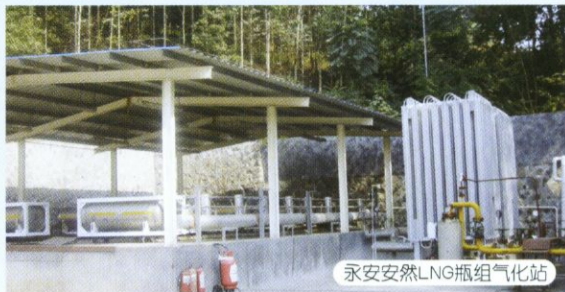
永安安然LNG瓶组气化站

占地2.5万m 2 ，8个150m 3 立式低温储罐，可储备72万m 3 天然气，年供气能力8800万m 3 。