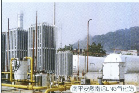
南平安然南岭LNG气化站

18个LNG绝热气瓶储气，可冲装2826kg LNG，采用LNG空温式低温液体汽化器，气化量600m 3 /h。