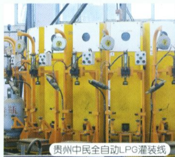
贵州中民全自动LPG灌装线

西南地区最大的气库，占地6万m 2 ，库容达2500t，5个100m 3 卧罐和3个1500m 3 球罐。