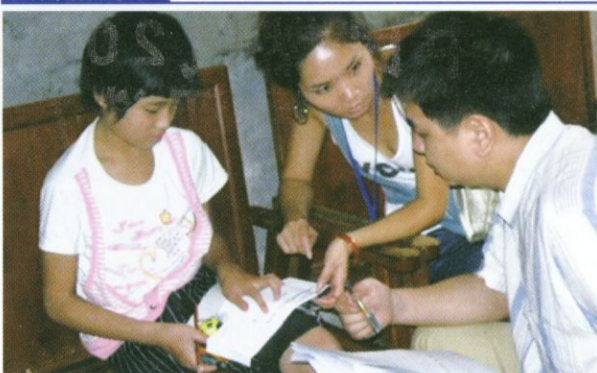
(图为中民安然爱心行动小组辅导受助同学学习)