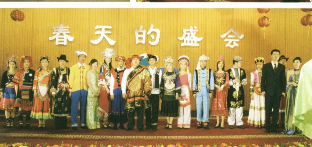
少数民族服饰表演