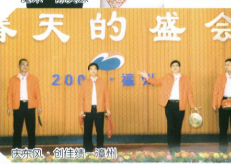
庆东风—创佳绩—漳州