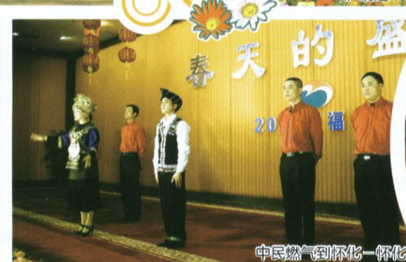
中民燃气到怀化—怀化