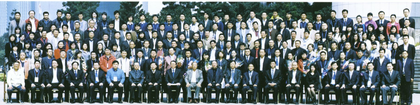
出席会议的领导与参会代表合影留念