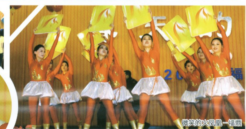
微笑的火凤凰—福鼎